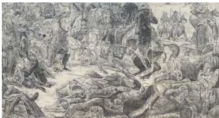
言葉で上手く言えないから、筆を取った