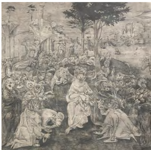
Hold me tight